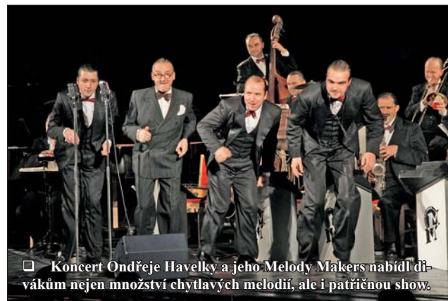
□ Koncert Ondřeje Havelky a jeho Melody Makers nabídl divákům nejen množství chytlavých melodií, ale i patřičnou show.