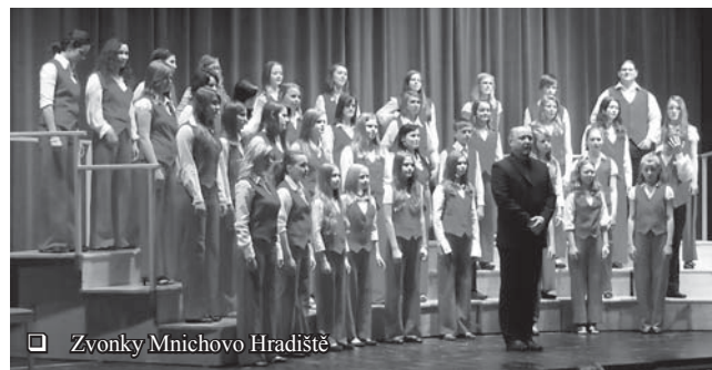
Zvonky Mnichova Hradiště

Soutěž probíhala od 9.30 hodin ve třech blocích, přičemž prvním vystupujícím sborem bylo pochopitelně skutečské Cantando pod vedením sborníka Zdeňka Kudrnky. Následovalo 1. oddělení Pramínku z Pardubic a poté 2. oddělení Zpěváčků,