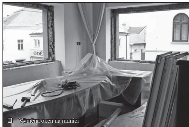
Výměna oken na radnici

výstavby výtahu i tyto práce probíhají za plného provozu. Pochopitelně dochází k omezení činnosti jednotlivých odborů a kanceláří a úředníci nemohou pokaždé vyjít vstříc požadavkům občanů s ohledem na dostupnost počítačů, popř. výpadkům serveru apod. Navíc se budou některé kanceláře i stěhovat (městská policie, odbor kultury). Z těchto důvodů prosíme o pochopení a trpělivost. Společnost SKOS, s.r.o. Skuteč, která je zhotovitelem investice, se snaží o maximální urychlení prací, nicméně k dokončení dojde až během prázdninových měsíců.