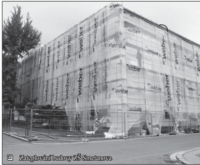
Zateplování budovy ZŠ Smetanova

Také při pohledu na radnici si občané mohou všimnout prvních změn. V druhé polovině května se i zde začala vyměňovat okna. Vedle