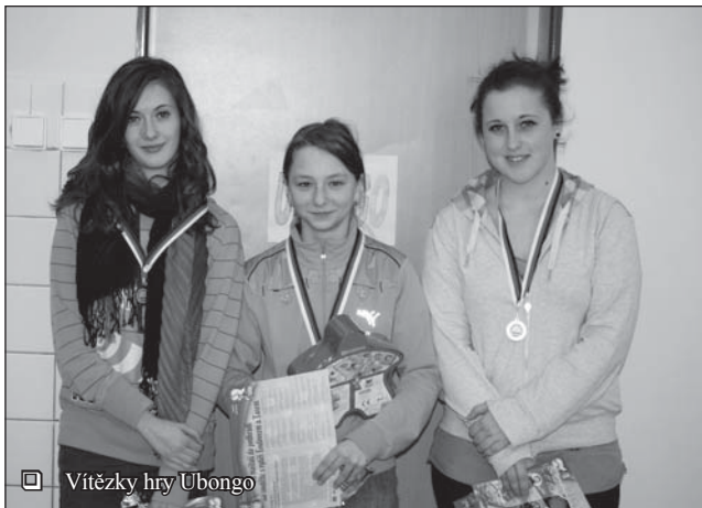
Vítězky hry Ubongo

Stejně jako v životě, tak i v každé podobné hře, je potřeba nejen trénink, ale i trocha toho štěstí. Celé herní dopoledne probíhalo v příjemné atmosféře a po dobrém obědě v naší školní jídelně jsme se pustili do vyhodnocení jednotlivých turnajů. I v letošním roce se nám za vydatné spolupráce sponzorů podařilo zajistit dostatek cen, takže si každý účastník turnajového klání mohl odnést kromě medového perníčku také jednu z připravených cen, např. PC hru, deskovou hru (Carcassonne, Hive Pocket), tričko, sadu fixů, propisku, samolepicí bloček, zápisník, baterku, CD disk, knihu o významném vědci (Archimédes, Albert Einstein, Johannes Kepler, René Descartes...), publikaci se zajímavými matematickými úlohami, přívěšek Rubikovy kostky, kružítka apod.