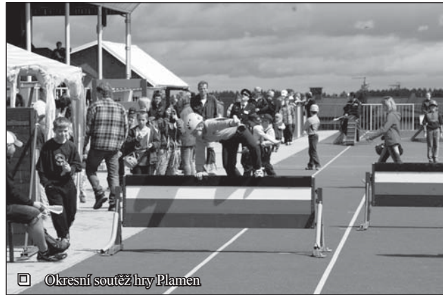
Okresní soutěž hry Plamen