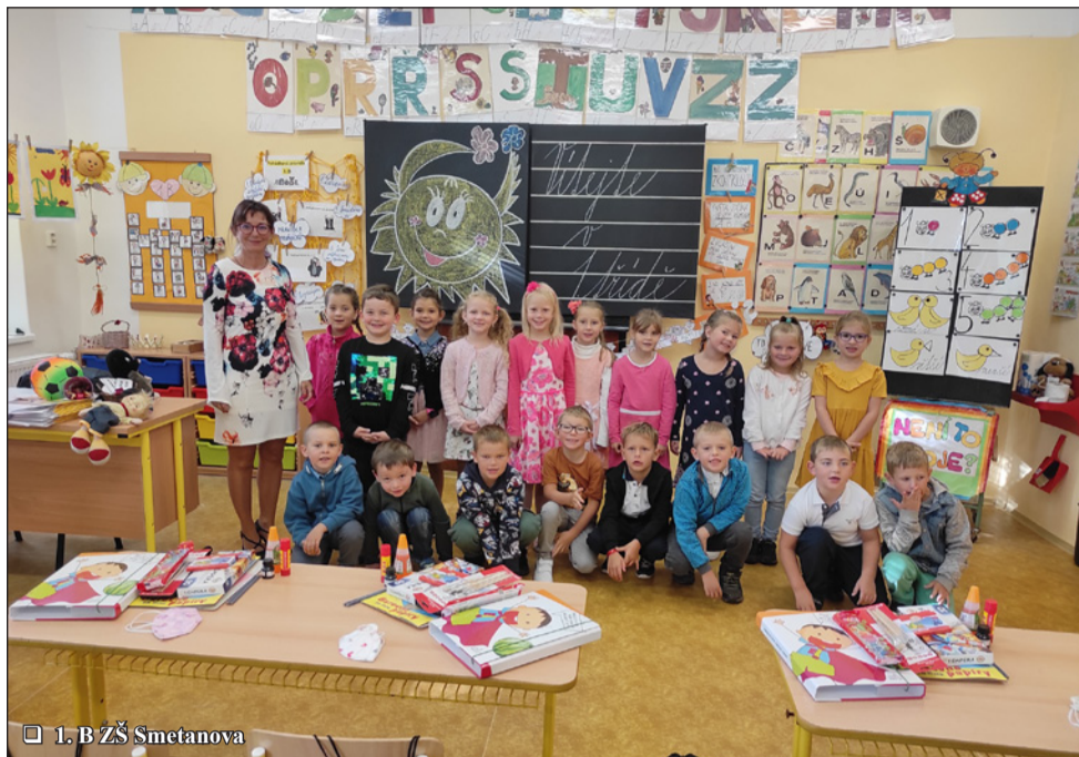
1. B ZŠ Smetanova