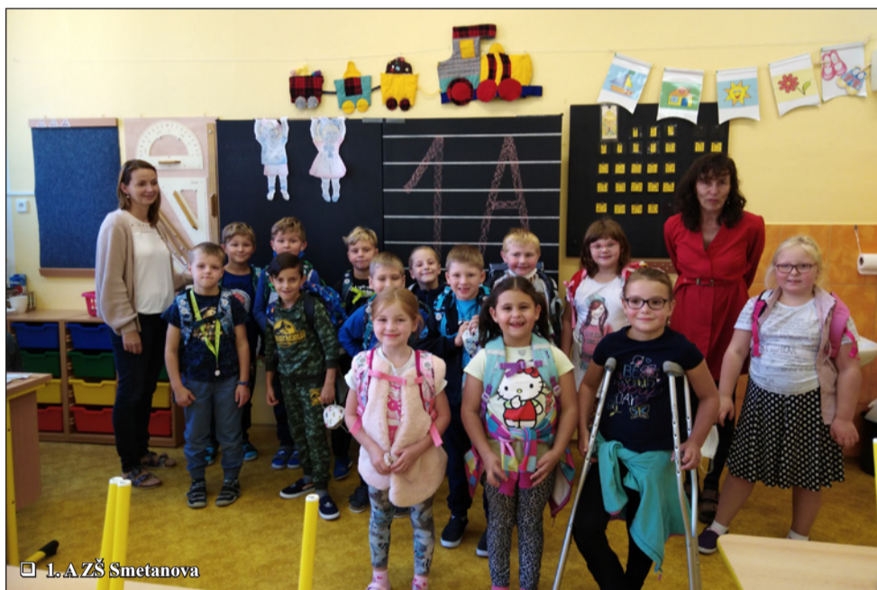
1. A ZŠ Smetanova