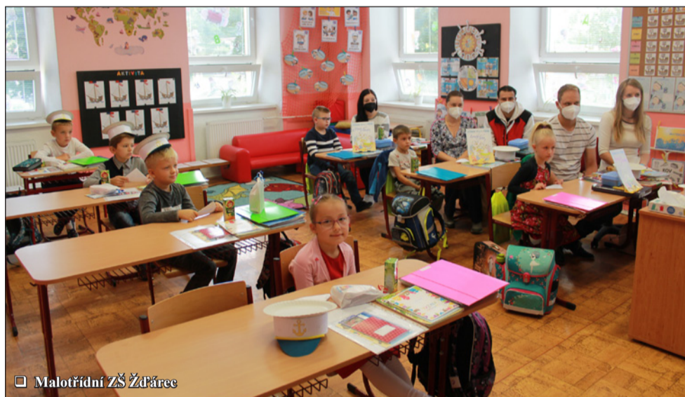
Malotřídni ZŠ Žďárec