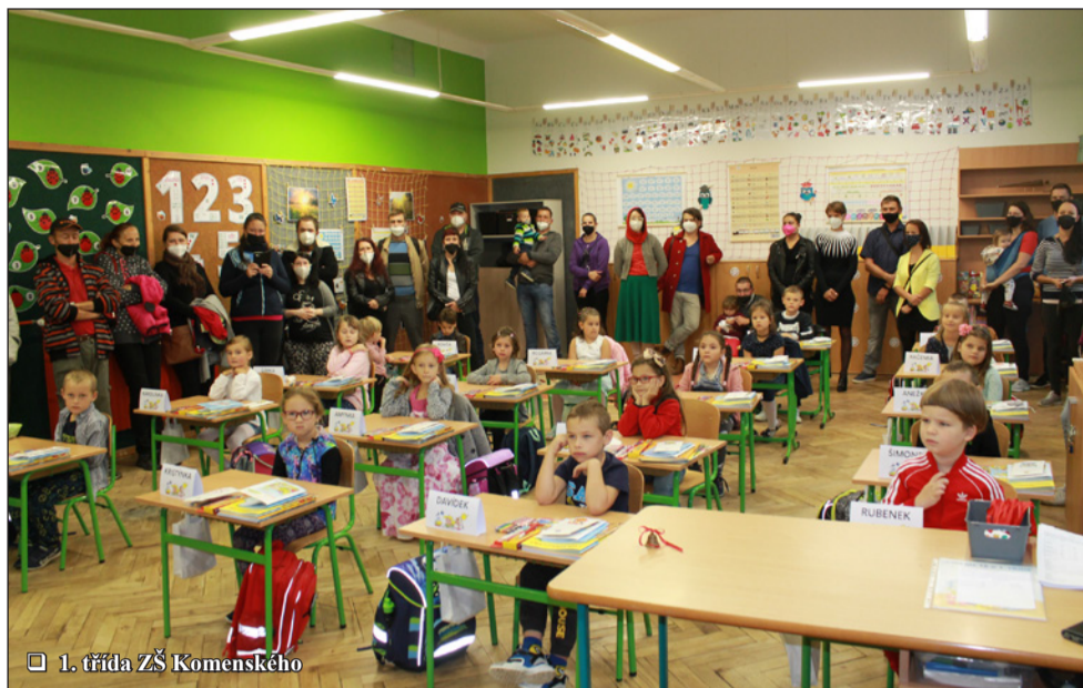
1. třída ZŠ Komenského