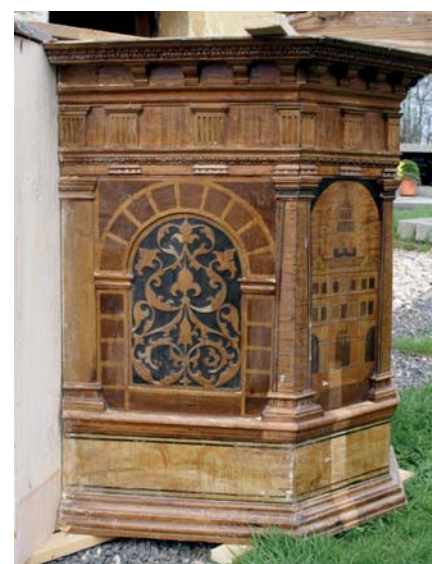
☐ Snímky kazatelny před rekonstrukcí a detail z její demontáže.