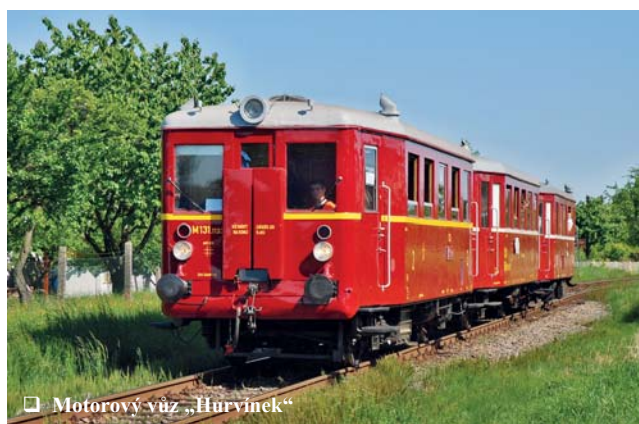
☐ Motorový vůz „Hurvínek“