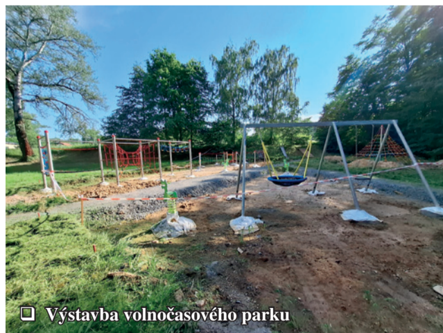
Výstavba volnočasového parku

kvůli bezpečnosti, naplánováno rozšíření vydlážděného prostranství. I zde jsme však narazili na nedostatečné podloží a bude třeba prostor nejprve řádně zhutnit. V současnosti již stojí opěrná zeď se zásypem vyrovnávajícím terén. Zpevněný prostor vybudujeme až po dokončení rekonstrukce budovy domova důchodců tak, aby nedošlo k poškození nové dlažby. Budova bude mít nový výtah, na zakázce za necelých 1,3 mil. Kč se již pracuje. Zbylé investice (výměna oken, zateplení a oprava střechy) jsou v plánu na příští rok.