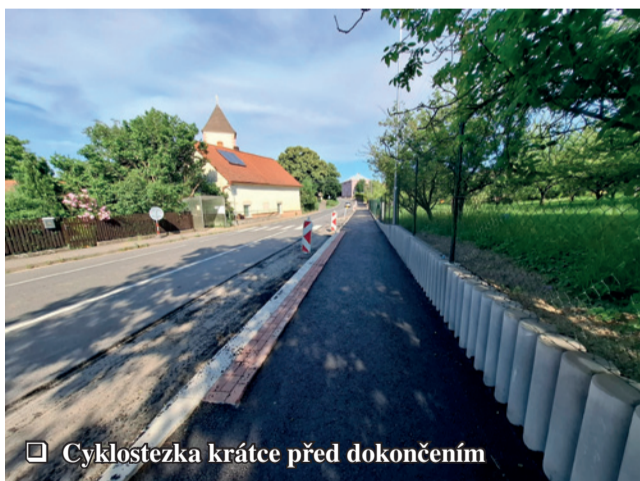
Cyklostezka krátce před dokončením

Po provedeném doprůzkumu by v polovině prázdnin měla začít sanace nebezpečné skládky po firmě Velamos. Po odtěžení vrchní části zeminy zajistí firma Ekomonitor, s.r.o. odvoz odpadů obsahujících těžké kovy a jejich ekologickou likvidaci. Kapalná frakce by se měla odčerpávat z nejnižší položeného místa, sanační technologie ji přečistí od kontaminantů.