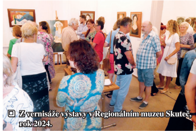
☑ Zvernisaže výstavy v Regionálním muzeu Skuteč, rok 2024.