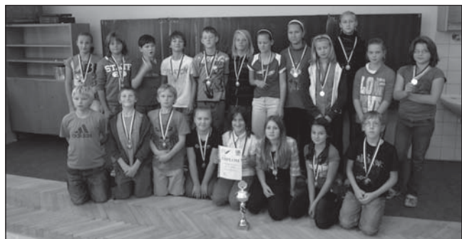
☐ Ve školním roce 2011/12 se žáci prvního stupně úspěšně zúčastnili spolu s dalšími 33 školami Atletického čtyřboje Pardubického kraje.