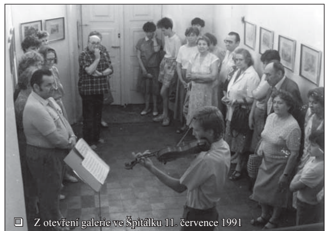
Z otevření galerie ve Špitálku 11. července 1991