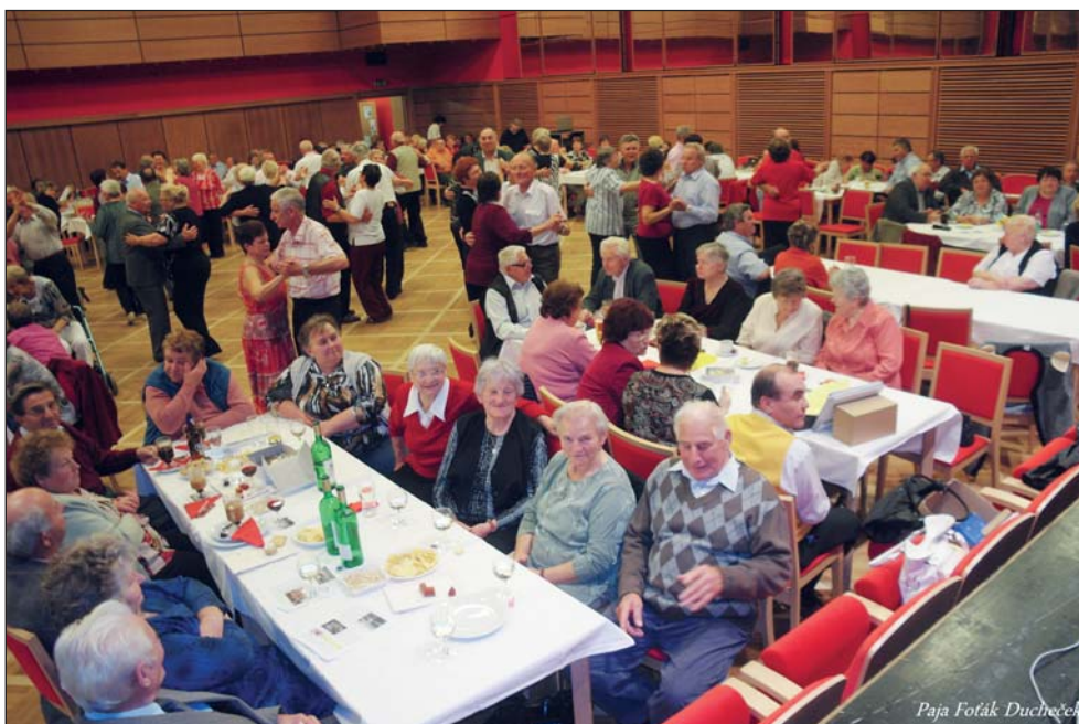
Paja Foták Duchčech

Na Dni s dechovkou byla zveřejněna pozvánka na další akci s dechovkou. Měl jí být 2. prosince Vánoční koncert Novověšťanky. Bohužel došlo ke zrušení koncertu, za což se omlouváme. Kapela Novověšťanka v námi předem zmluveném termínu přislíbila vystupování na jiném místě a náhradní termín z naší strany již nepadá v úvahu.