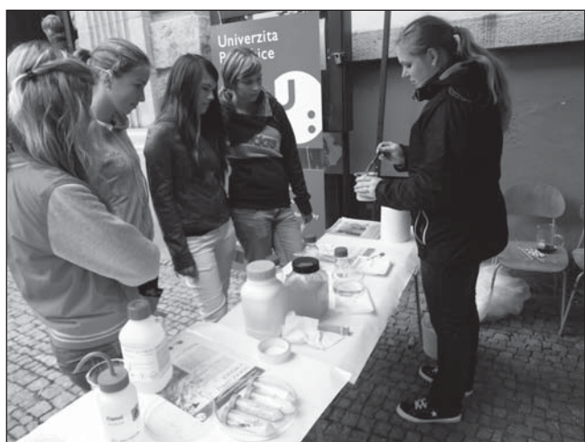
☐ ZŠ Komenského navštívila Univerzita Pardubice a ukázala žákům řadu zajímavých chemicko-biologických pokusů, dálkově ovládaných robotů a modelů aut.

Školy jsou místem, kde je neustále živo. ZŠ Komenského jistě není výjimkou, i zde se v průběhu roku i mimo vyučovací hodiny stále „něco děje“. Níže otiiskujeme dvě fotografie jako malou ukázkou, více naleznete na webových stránkách školy s adresou: www.zskomenskeho-skutec.cz