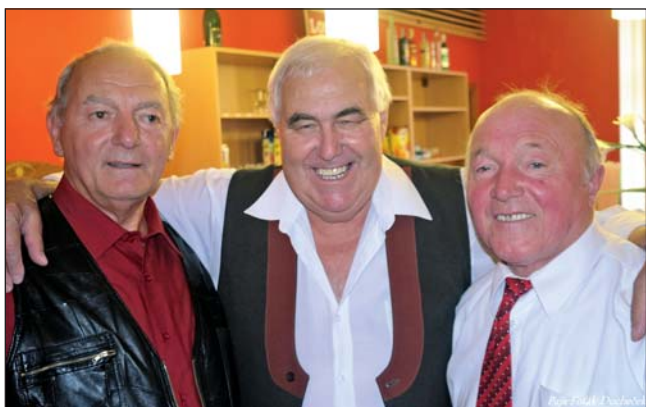
Paja Foták Duchčech

□ Nejen poslech pěkné hudby a tanec. Den s dechovkou je místem mnoha příjemných přátelských setkání.