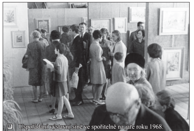
Uspořádání výstavní síně ve spořitelně na jaře roku 1968.